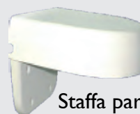
Staffa parete SDB-050 (in opzione)