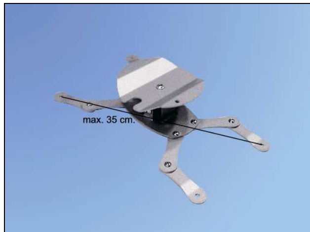
PROJECTOR ARM B-7 - vista laterale