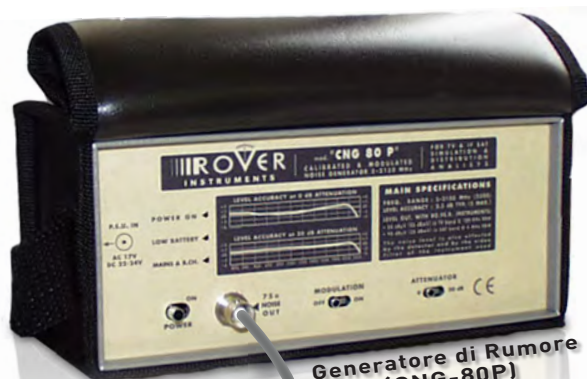
Generatore di Rumore (CNG-80P)