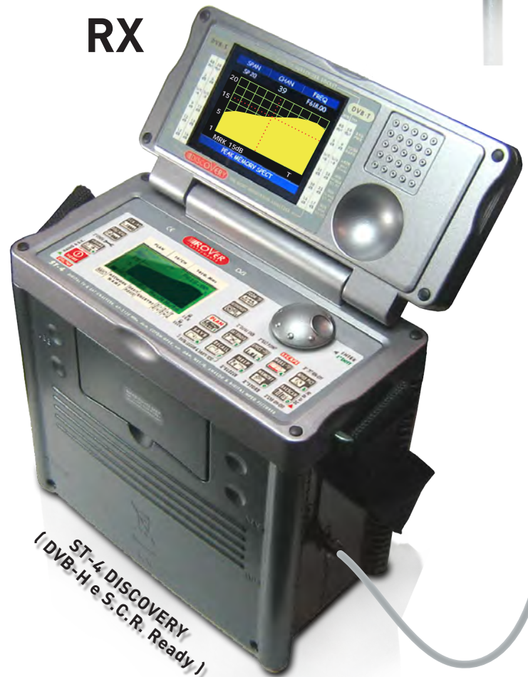
ST-4 DISCOVERY (DVB-H e S.C.R. Ready)

* Partecipa anche tu alla promozione visitando il sito www.skylinksas.com oppure inviando i tuoi dati al fax 039/245.7591. (Promozione valida dal 05/09 al 25/09/07. Regolamento disponibile on-line)